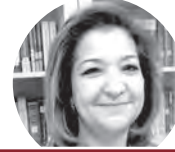
SELMA GHADAFİ KETENE

Tarihi dokusuyla nezih bir ortamda, dijital eğitim teknolojileriyle donatılmış sınıflarda, uzman akademisyenlerce verilen derslerimize sizleri bekliyoruz.