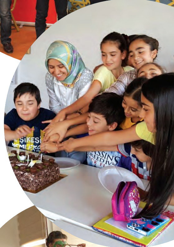
“2016 Uluslararası Öğrenciler Akademisi”

Her yaştan çocuk ve gençlerin ilgisini çekecek yamaç paraşütü, tiyatro, gezi ve etkinlikler gerçekleştirirken, düşünce atölyesi, Kur'an Algımız, Metin Yazarlığı, Ahlak Felsefesi gibi derslerle düşünmeye sevk edecek dersler yapılmaktadır. Anadolu İlahiyat Derneği, kuruluş ilkeleri doğrultusunda, gençleri odak noktası kabul eden çalışmalarında kamu ve özel kuruluşların ortak girişimlerine açık olarak yoluna devam etmektedir.