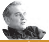
MUSTAFA ÖZTÜRK Tefsir